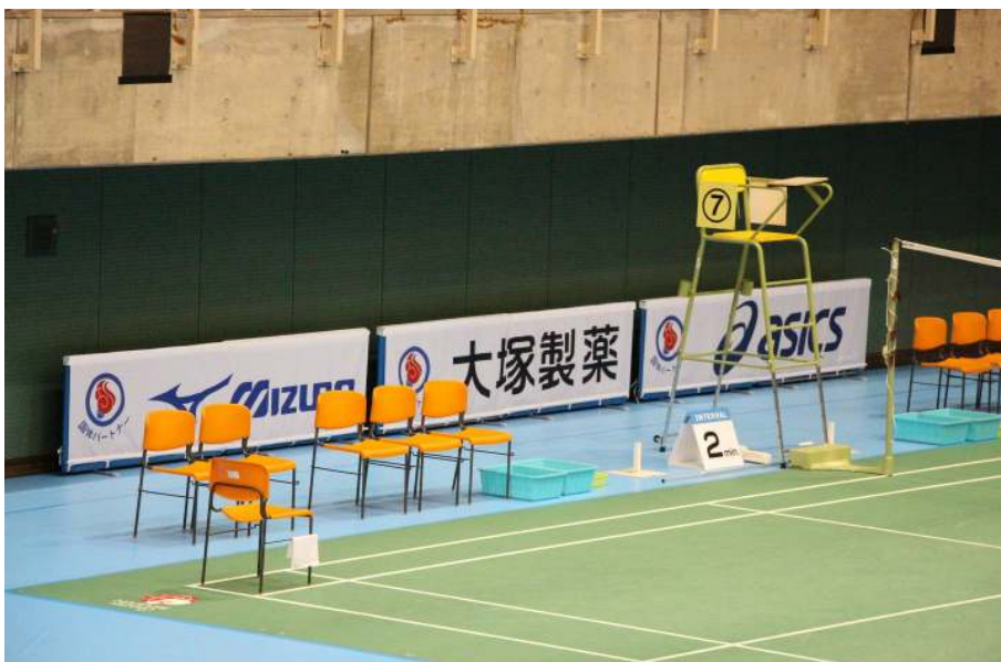
スポンサーの宣伝