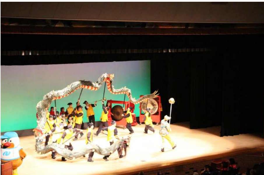
長崎くんちの『龍踊』披露