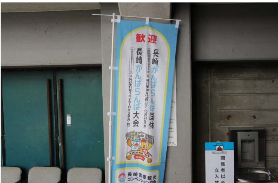
がんばらん場国体旗