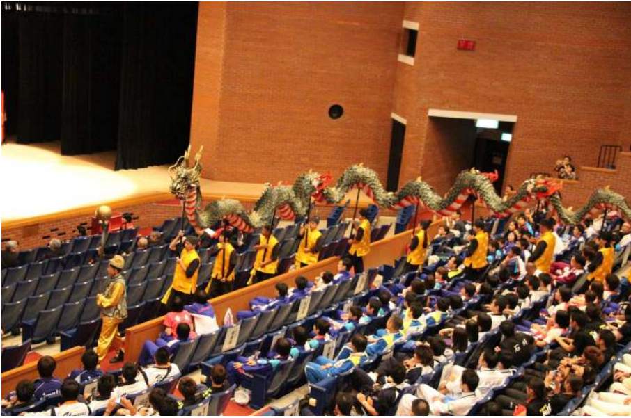
長崎くんちの『龍踊』披露