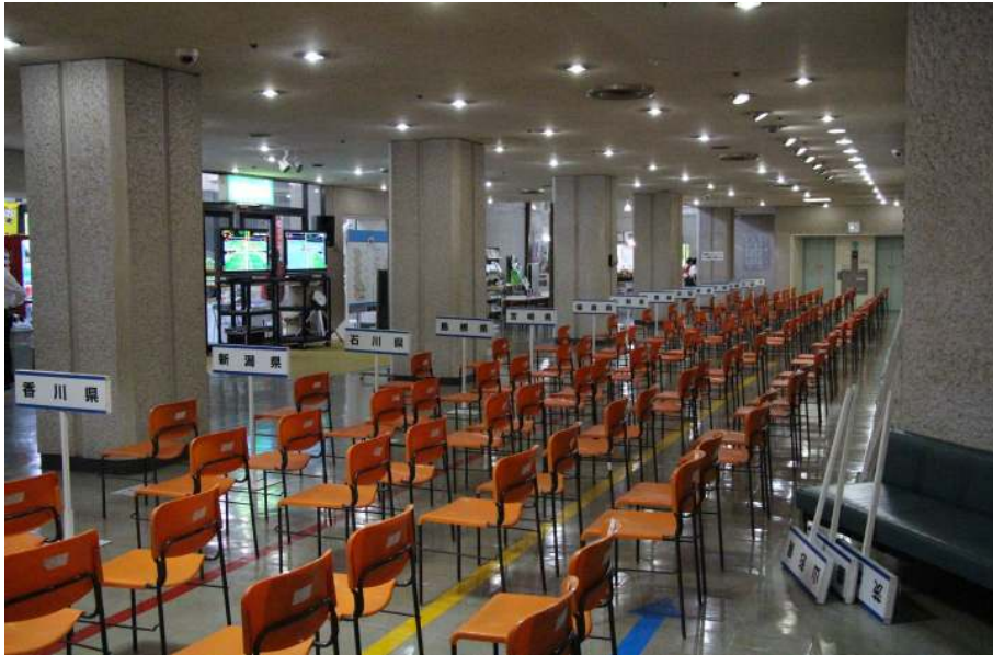
試合直前の集合場所