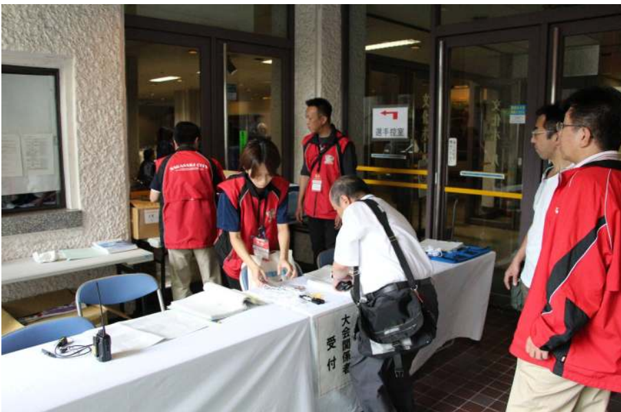
大会関係者受付 ここで首にかけられるIDカードが発行されます