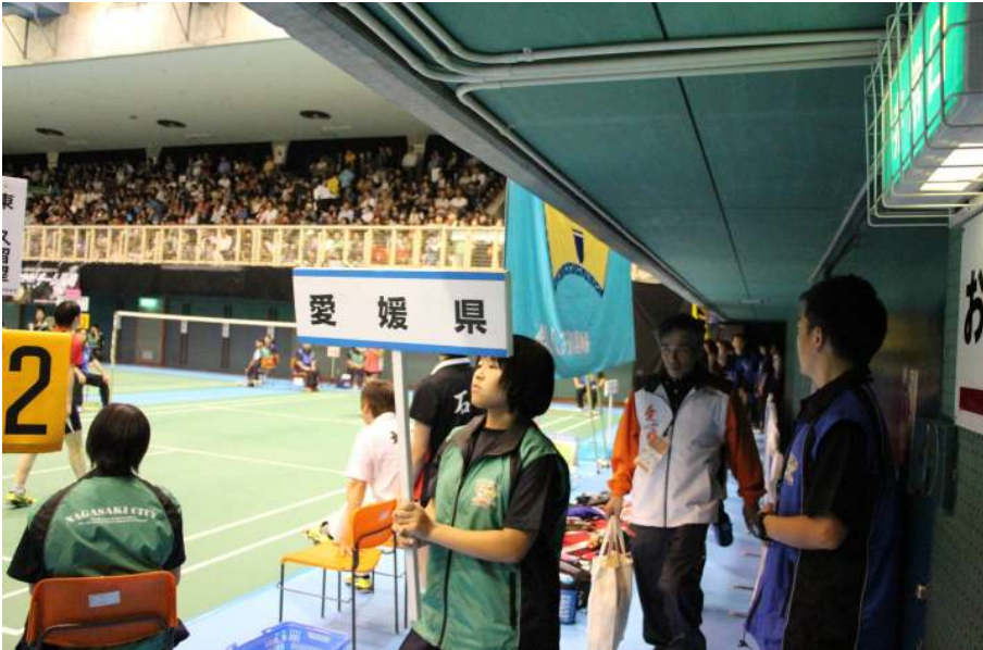
プラカードを先頭に選手入場