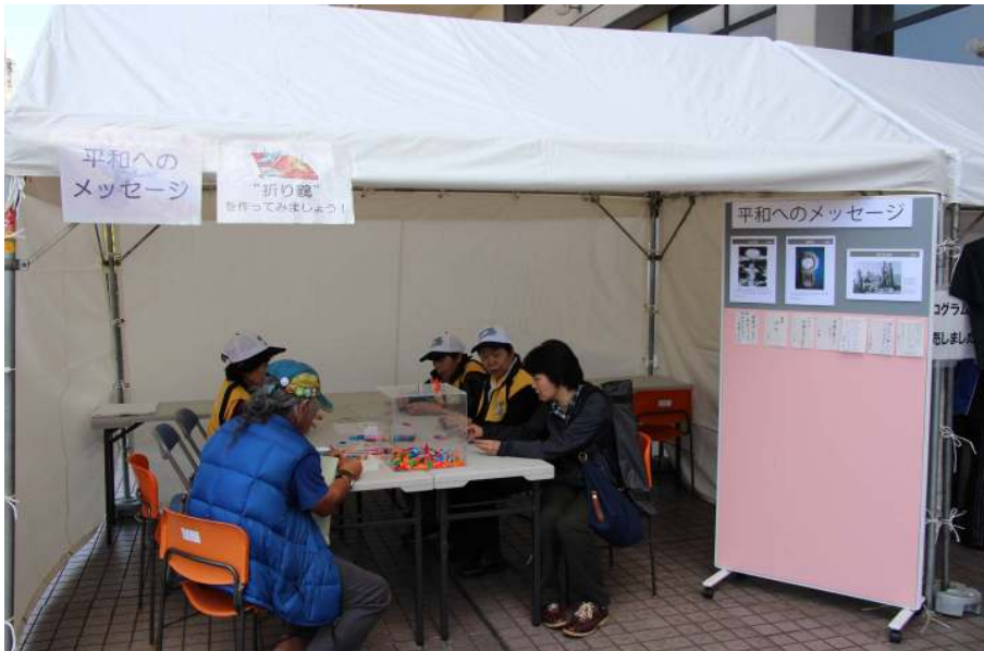
平和へのメッセージ 千羽鶴ボランティア