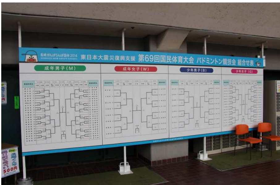
トーナメント掲示版