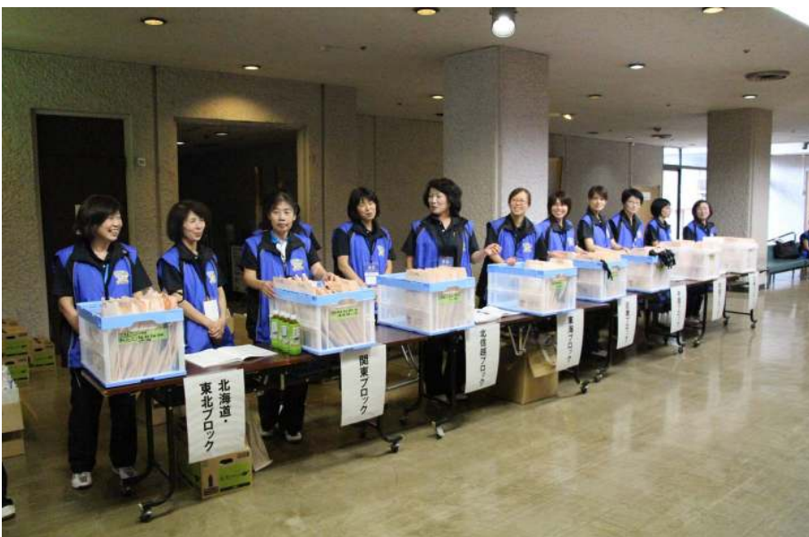
監督会議の受付状況