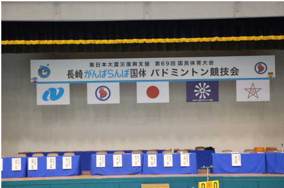
ひな壇セッティング