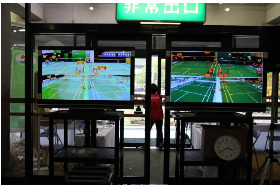
待機所から全コートに進捗が 確認できます