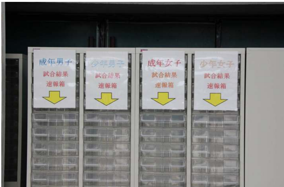
結果速報 点数等の詳細結果が随時追加され、一般の方も持ち帰ることができます