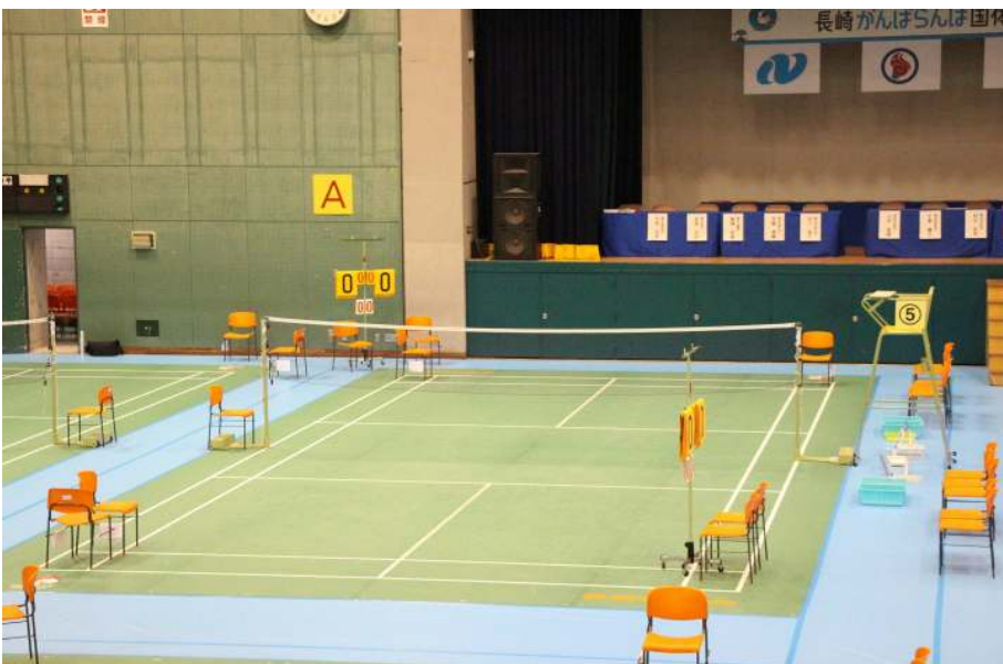
コートセッティング