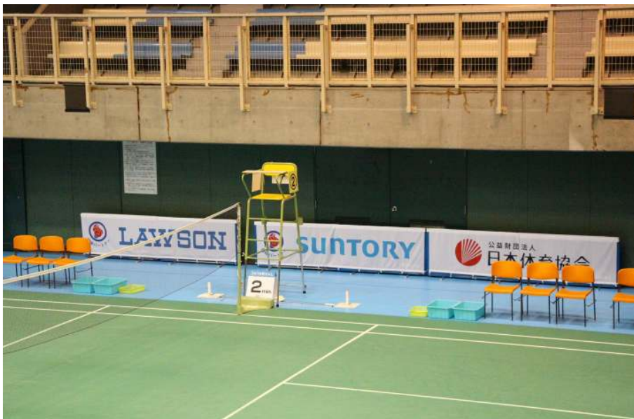
スポンサーの宣伝