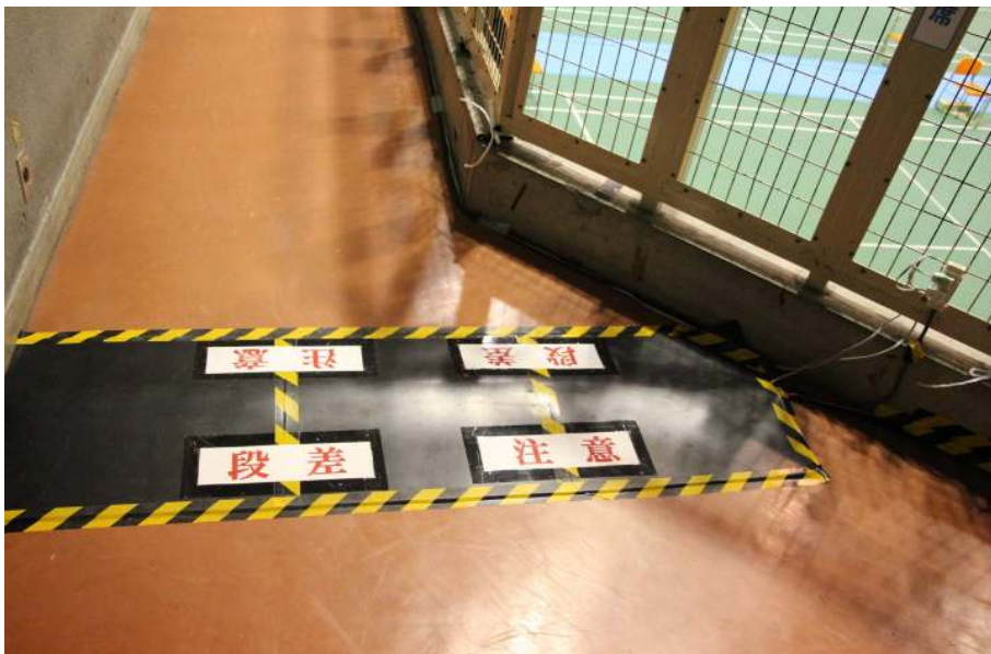
コードなどの養生