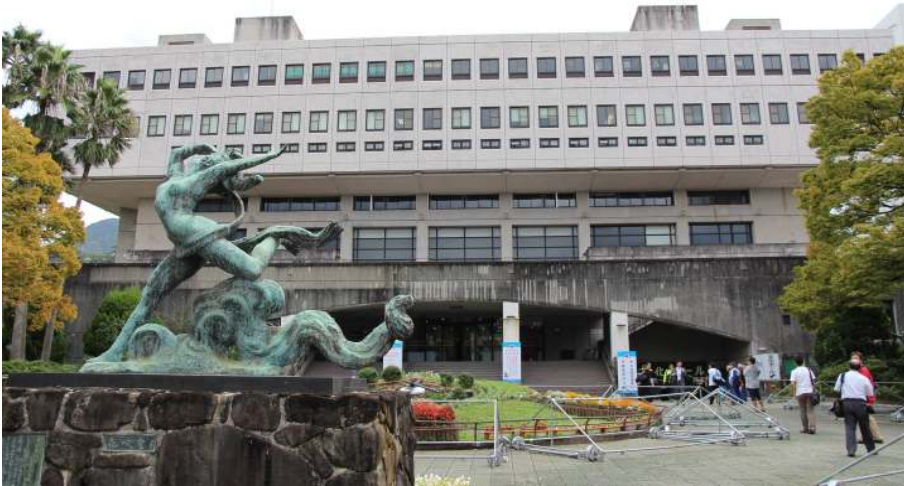
長崎国体会場 長崎市民体育館