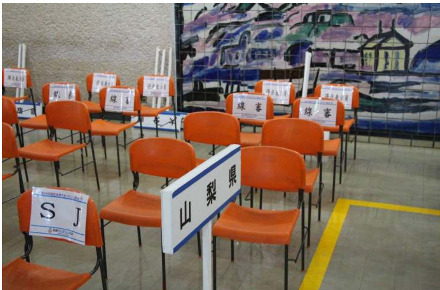
試合直前の集合場所 サービスジャッジ、選手、線審 を主審が誘導して入場