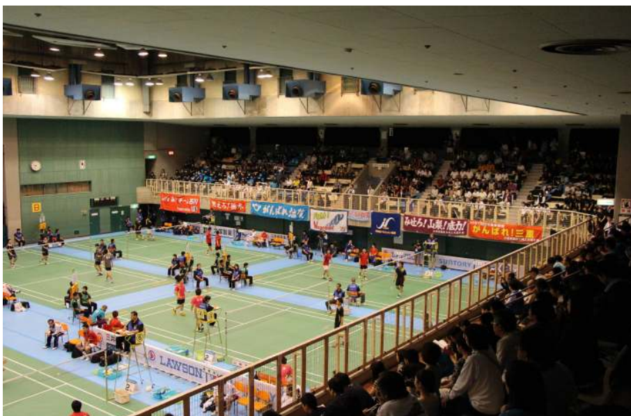
試合開始 会場の様子