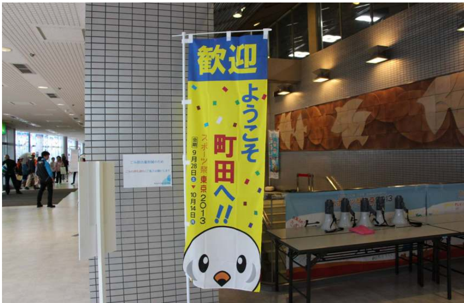
国体会場の様子 国体歓迎旗