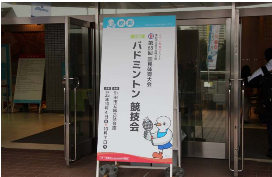
国体会場の様子 競技会メイン看板