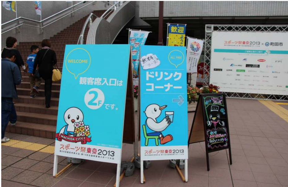
国体会場の様子 ドリンクコーナー